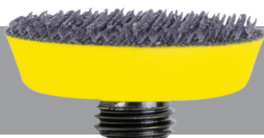
NTools nr 150540 на липучку