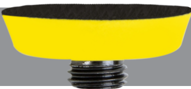
NTools nr 150542 на клей