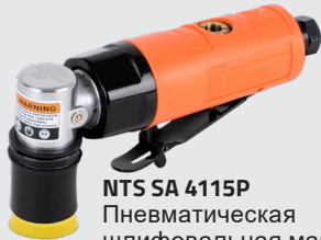
NTS SA 4115P Пневматическая шлифовальная машина для малых поверхностей APP № 139210