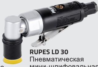
RUPES LD 30 Пневматическая мини-шлифовальная машина APP № 131110